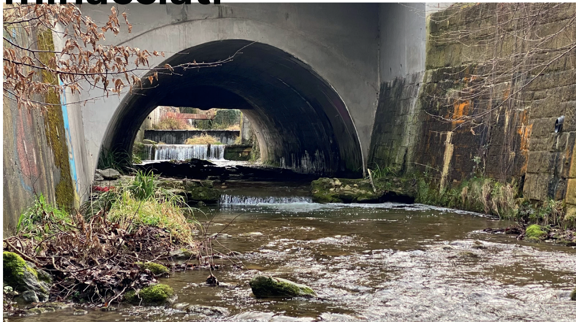
15.000 km dei corsi d'acqua svizzeri sono stati rettificati, incanalati o addirittura coperti.

Più di un quinto delle specie minacciate o già estinte vive nei corsi d'acqua, un altro quinto su rive e in zone umide. I pesci migratori soffrono della frammentazione dei corsi d'acqua. A causa del prosciugamento di stagni e zone umide, gli anfibi e gli odonati perdono i loro habitat, mentre la perdita di zone golenali colpisce anche numerose specie vegetali. Poiché gli specchi e i corsi d'acqua e gli habitat che li circondano ospitano oltre l'80 percento delle specie animali e vegetali conosciute in Svizzera, queste cifre sono ancora più significative. Dei corsi d'acqua pieni di vita non sono solo un vero e proprio hotspot di biodiversità, ma anche fonte di cibo, salute, benessere e gioia per noi esseri umani. Affinché possano continuare a offrire questi servizi, hanno bisogno di essere protetti meglio. L'Iniziativa biodiversità vuole garantire questo.