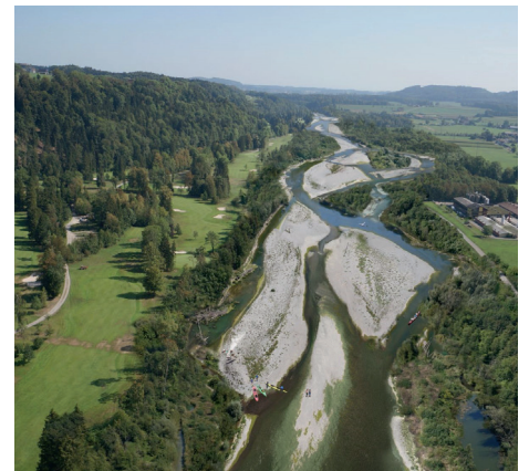
Il Thur presso Niederbüren, intorno al 1920, oggi e come visione futura.