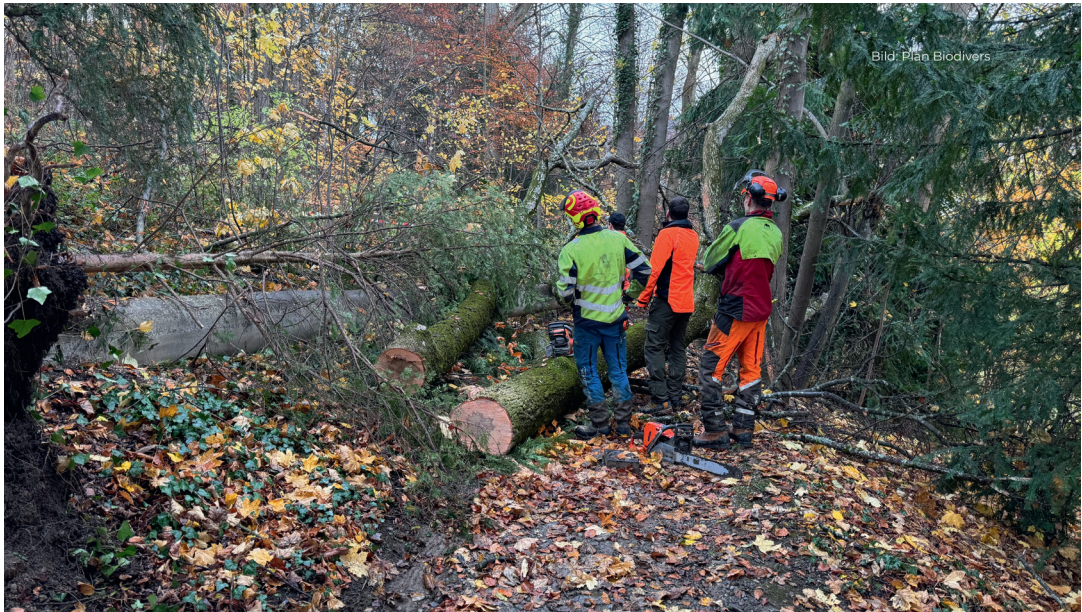
Oltre alla produzione di legname, anche la manutenzione dei sentieri fa parte del lavoro nel bosco.