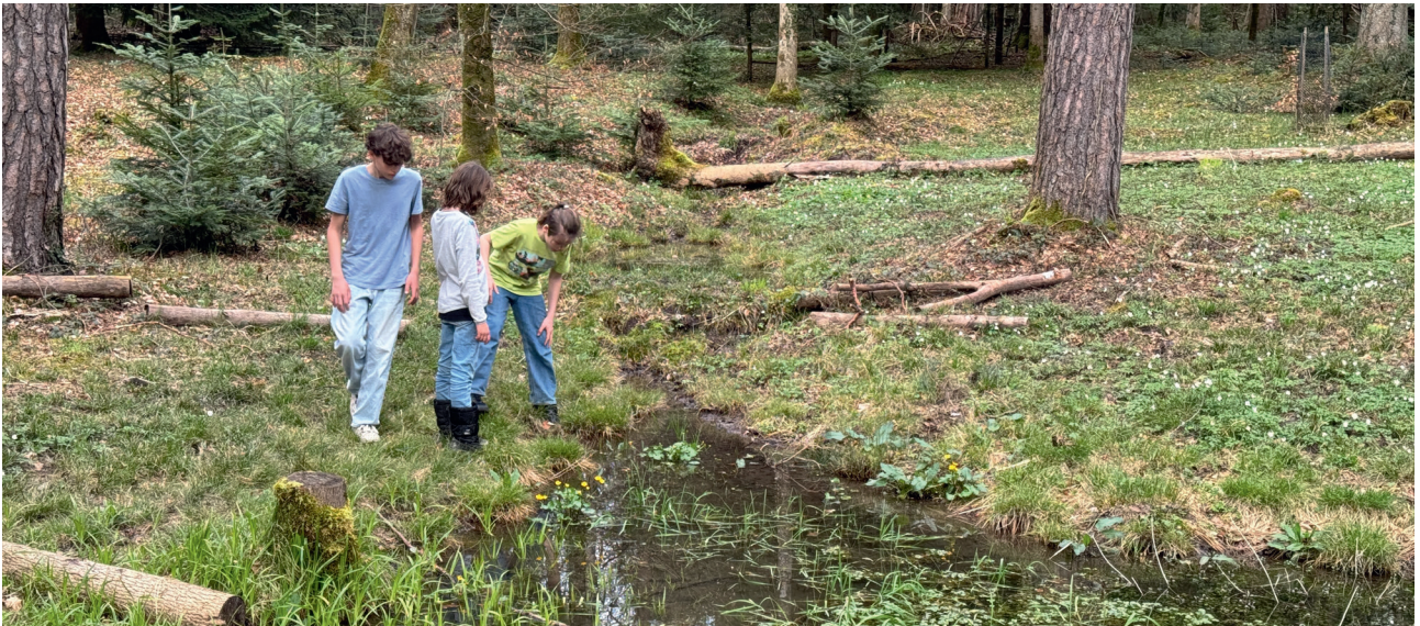
Il bosco è uno spazio ricreativo tranquillo.

Per i proprietari di boschi che accettano una riserva forestale o sostengono in altro modo la biodiversità, l'Iniziativa biodiversità rappresenta un'opportunità per ricevere maggiori contributi.