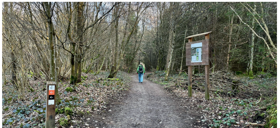
© Ufficio forestale della città di Baden