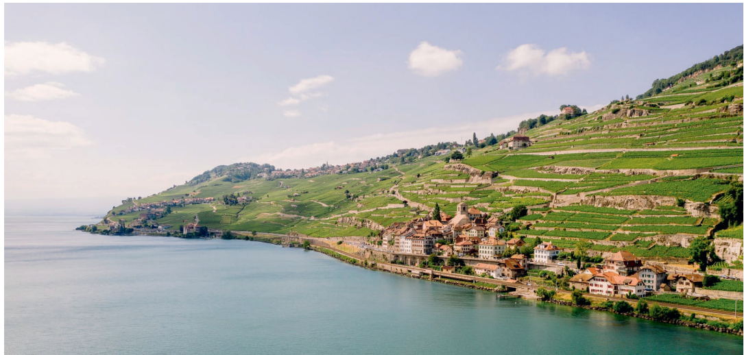
Il villaggio vitivinicolo di Saint-Saphorin sul Lago Lemano

perficie del Paese. A causa delle grandi dimensioni degli oggetti, l'inventario IFP è lo strumento fondamentale della politica svizzera di protezione del paesaggio.