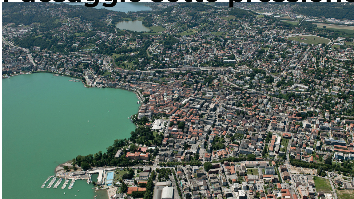
Lugano TI

La Svizzera è ricca di paesaggi preziosi e variegati. Questi sono un habitat naturale per animali e piante, sono importanti per le attività ricreative della popolazione e costituiscono una risorsa preziosa per il turismo. L'attività edilizia degli ultimi decenni ha messo a dura prova il paesaggio svizzero e la pressione continua ad aumentare a causa delle crescenti esigenze. L'Iniziativa biodiversità rafforza i paesaggi svizzeri come importante risorsa per il nostro futuro.