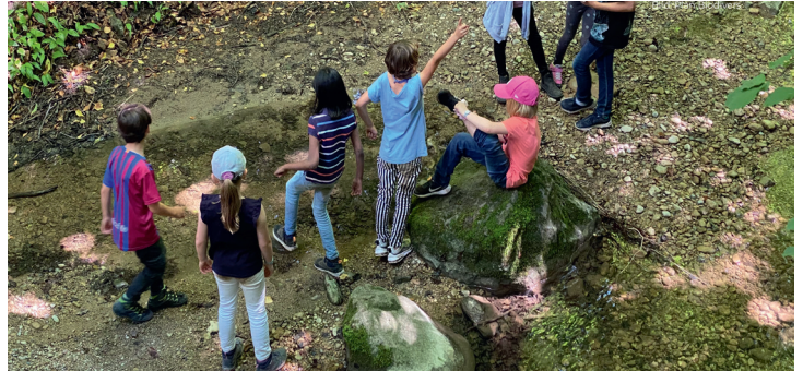
Bambine e bambini si sviluppano meglio in un ambiente prossimo allo stato naturale.