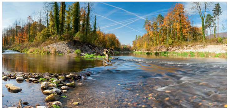
Parco di protezione delle zone golenali del Canton Argovia.