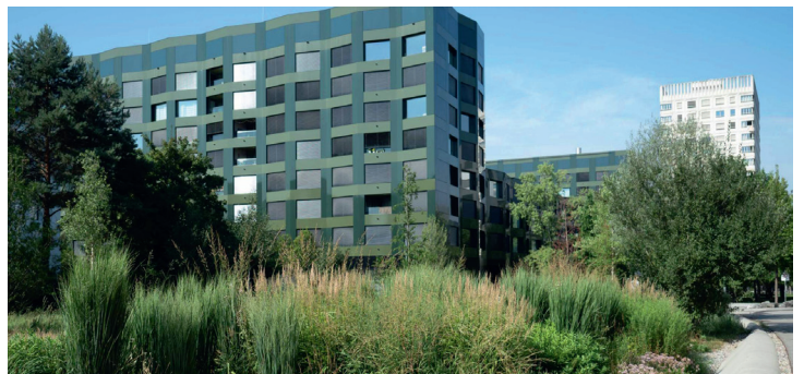
Schlieren, al Rietpark: il terreno irregolare sistemato in modo naturale raccoglie l'acqua piovana dopo le precipitazioni e favorisce la percolazione.