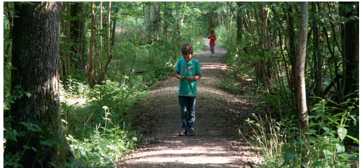
I boschi prossimi allo stato naturale, le brughiere, i fiumi e le zone umide con un alto livello di biodiversità ci offrono la migliore protezione contro le conseguenze dei cambiamenti climatici.