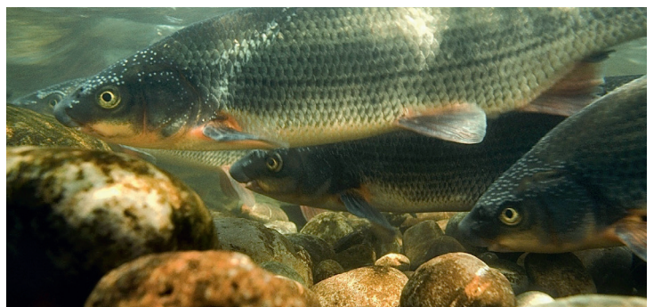
I pesci migratori come questi nasi hanno bisogno di fiumi senza ostacoli per raggiungere le loro acque di riproduzione.