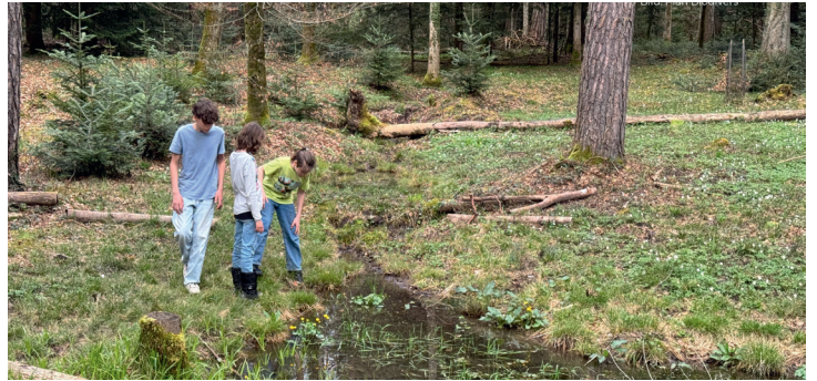
Boschi radi e umidi sono particolarmente ricchi di specie, ma anche rari.